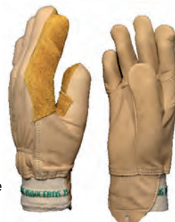
Un gant coqué

Un gant non coqué (qui tient le sécateur) n'est pas équipé de doublure, ceci permet une meilleure sensibilité sur la gâchette.